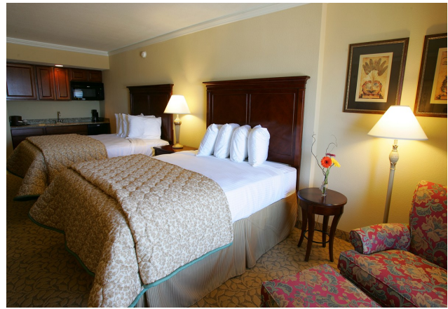
Hotelroom mit Double Beds