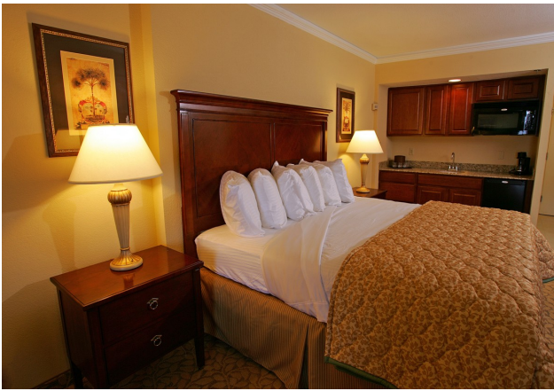
Hotelroom mit King Bed